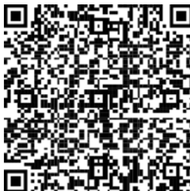
Figure 1 Android code QR pour ouvrir l'App Store

Pour installer l'application Authenticator sur un appareil Android, analysez le code QR ci-dessous ou ouvrez la page de téléchargement à partir de votre appareil mobile.