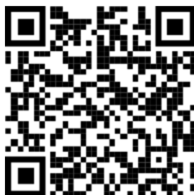
Figure 2 iOS code QR pour ouvrir le App Store

Pour installer l'application Authenticator sur For iOS, analysez le code QR ci-dessous ou ouvrez la page de téléchargement à partir de votre appareil mobile.